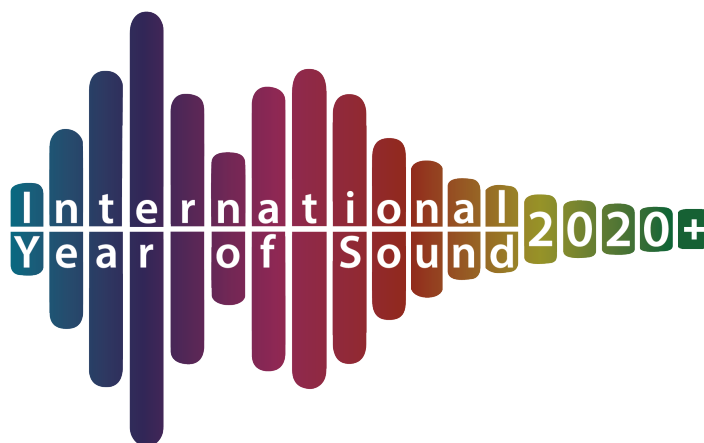
Figura 1: Logo do International Year of Sound 2020 & 2021 — IYS+.

Em 2019, como desdobramento dos objetivos da Resolução 39C/59 da UNESCO e de forma a cooperar para ampliar seu reconhecimento mundial, a Comissão Internacional de Acústica (ICA) e a organização de “ La Semaine du Son ” assinaram um memorando declarando 2020 como o Ano Internacional do Som, numa iniciativa global com a finalidade de divulgar a importância do som em todos os aspectos da vida na Terra, veja a Figura 1.