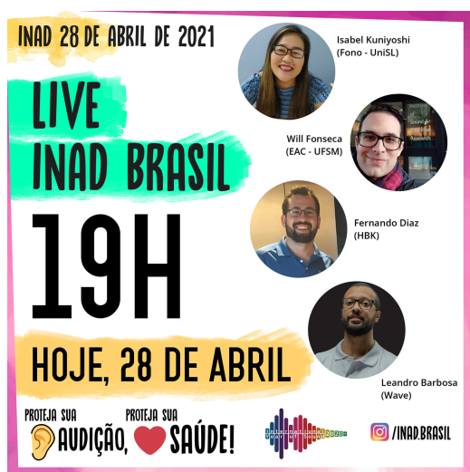
(b) Convite da Live.