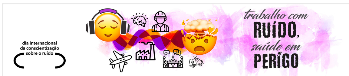
Figura 3: Banner do INAD Brasil 2020.

A Associação Brasileira para a Qualidade Acústica (ProAcústica) promoveu o IYS por meio da campanha “ Viva esta onda ”, que convidava todos a vivenciar a experiência do som a sua volta [5]. Com divulgações em seu portal, redes sociais, peças publicitárias, encontros e eventos digitais, newsletters , apresentações institucionais, vídeos, entre outros, o IYS foi amplamente destacado nos dois anos. A ProAcústica também participou do INAD 2020 com a ação #SonsQueAmo [6], dos dias 29 de abril a 31 de outubro de 2020.